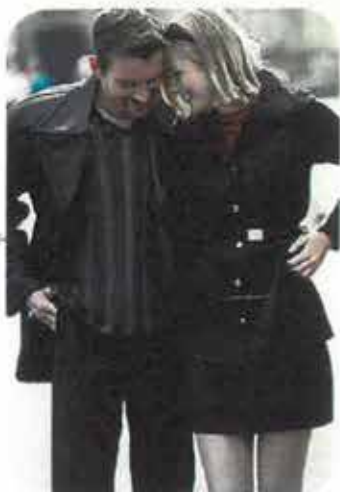
Hvad bli'r efterårets hit? Seks danske modefirmaer viser deres bud side 16.