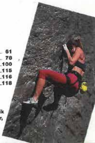
Side 28 går Indblik tæt på tre kvinder, der har valgt at leve livet farligt.