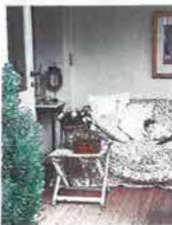
Dejlig dansk landsbyromantik kan du se i artiklen side 36.