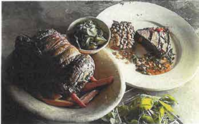
Læs alt om opskriftskonkurrencen med kalvekød side 102.