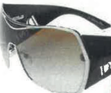
Hippie chik-stil. Side 61.