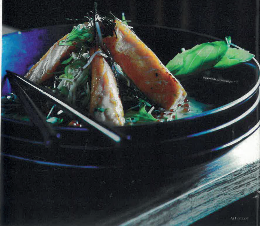
LAKS MED SAUCE AF LAKSEORREDROGN

– Dyrt: Den Gule Cottage i Klampenborg, som er perfekt til en romantisk middag. Middel: Spiseloppen på Christiania. Og billigt: Lele på Vesterbrogade i København.