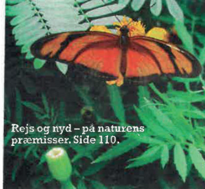
Rejs og nyd – på naturens præmier. Side 110.